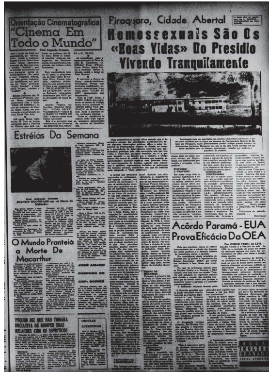
Diário da Tarde. Edição 20152, 1964. Paraná.

Acervo: Hemeroteca Digital Brasileira 10